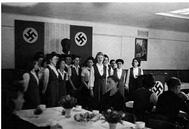
Werkfrauengruppe des RAW München-Freimann bei einer Muttertagsfeier, 1941