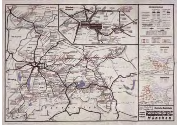
Übersichtskarte der Reichsbahndirektion München, 1940er Jahre