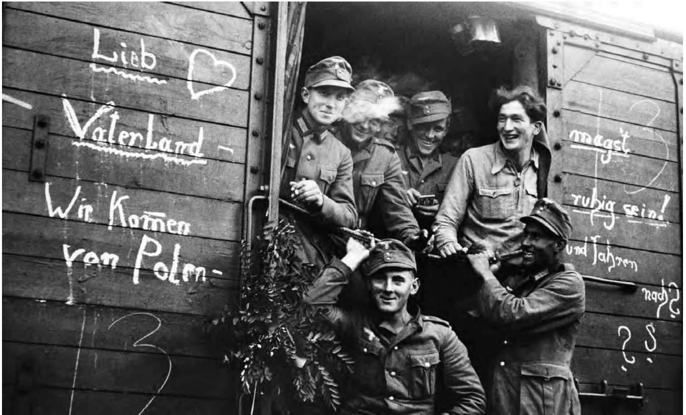
Wehrmachtssoldaten nach ihrer Rückkehr vom Polenfeldzug, Oktober 1939