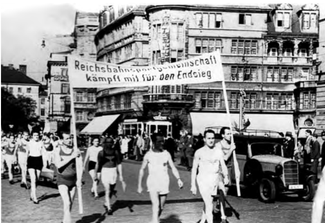
Münchner Reichsbahn-Sportler bekennen sich zum „Endsieg“, 1941 (Stadtarchiv München)