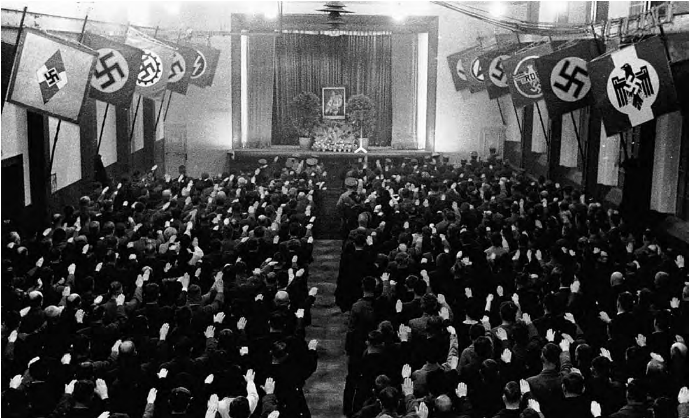
Betriebsappell im RAW München-Freimann, 1938