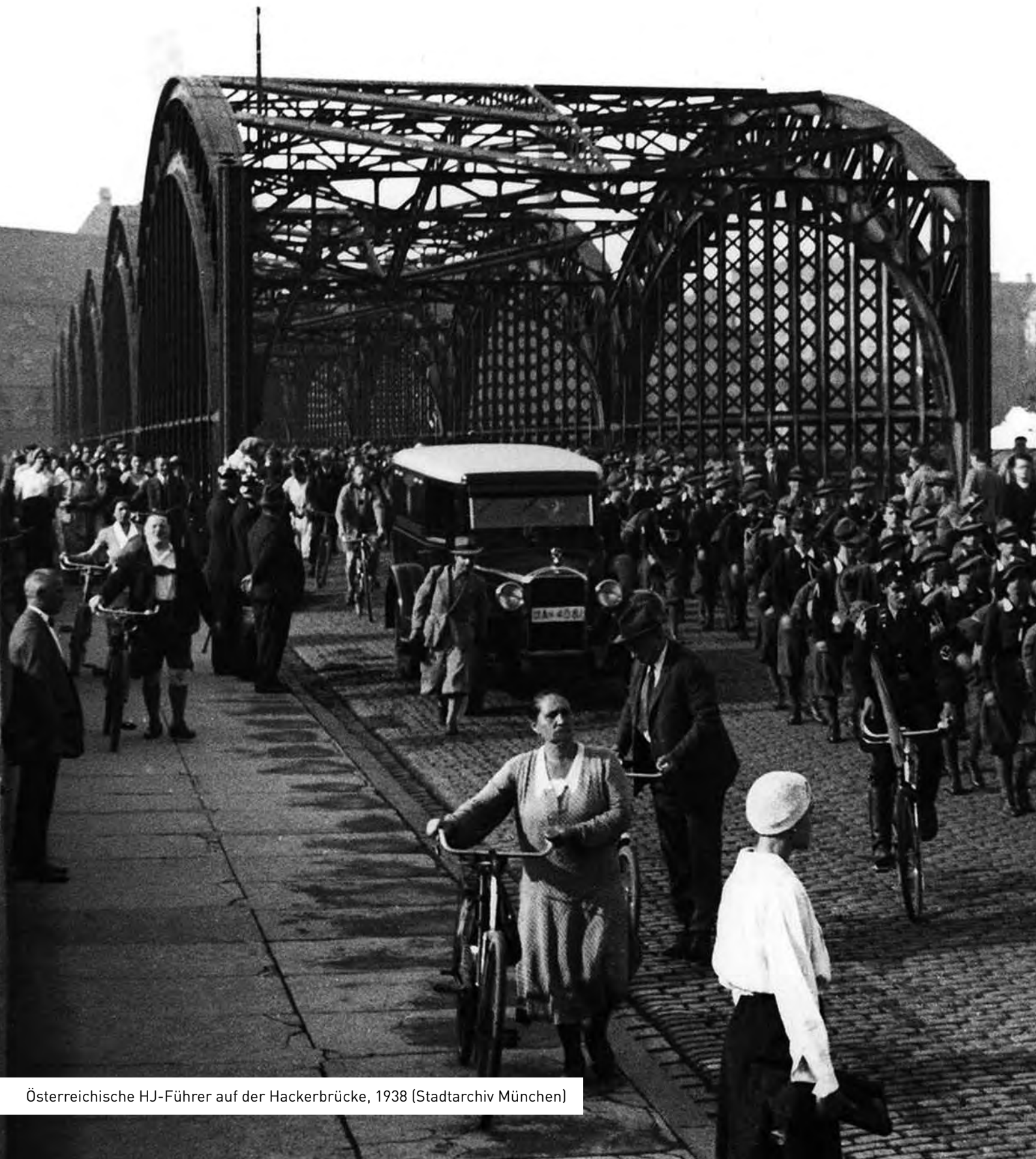
Österreichische HJ-Führer auf der Hackerbrücke, 1938