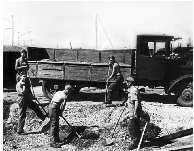
Britische Kriegsgefangene bei Bauarbeiten im RAW München-Freimann, 1942