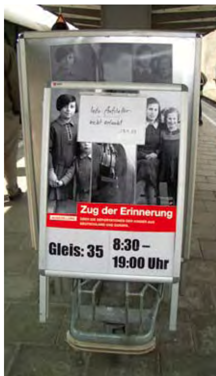
Informationsverbot für den „Zug der Erinnerung“ im Münchner Hbf, 28. April 2009

Die Bereitschaft der Deutschen Bahn AG zu einer umfassenden und konstruktiven Beschäftigung mit der eigenen historischen Rolle ist nach wie vor unzureichend. Die Haltung der deutschen Wirtschaft zum Umgang mit der NS-Geschichte und dem eigenen Anteil daran hat sich seit Ende der 1990er Jahre verändert. Im Gegensatz dazu zeigt die Unternehmensspitze der Bahn immer wieder eine fragwürdige und irritierende Verweigerungshaltung. Die Ausstellung macht in diesem Zusammenhang deutlich: Die Auseinandersetzung mit der NS-Vergangenheit ist ein gesamtgesellschaftlicher Auftrag, dem sich auch die Deutsche Bahn AG vor dem Hintergrund ihrer eigenen Geschichte zu stellen hat.