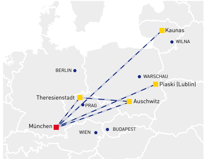
Orte der Vernichtung (Schematische Darstellung)