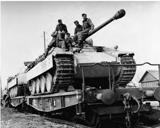
Transport von Kriegsgerät an die Front, ohne Datum