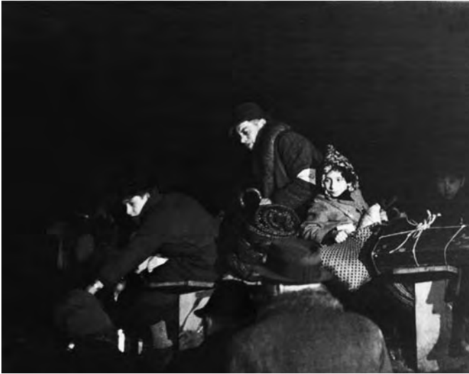
Vor der Deportation im Barackenlager an der Knorrstraße 148, 20. November 1941