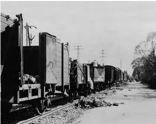
Bei der Befreiung des KZ Dachau stießen US Soldaten auf einen mit Leichen gefüllten „Evakuierungstransport“, 30. April 1945