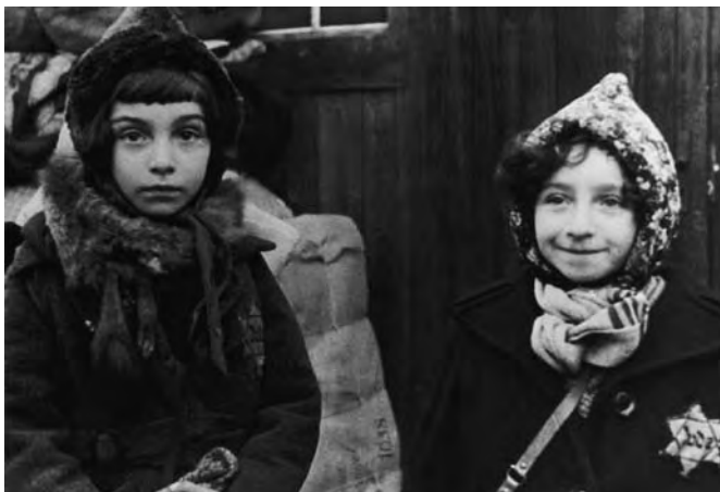
Vor der Deportation im Barackenlager an der Knorrstraße 148, November 1941