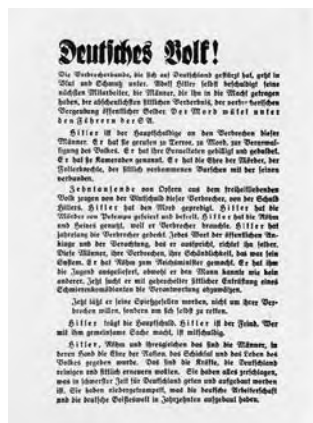
Flugblatt der Münchner Widerstandsgruppe „Rote Rebellen“, 1934