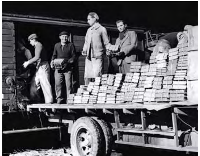
Transport von Beutegut, hier Büchertransport aus den besetzten Gebieten, ohne Datum