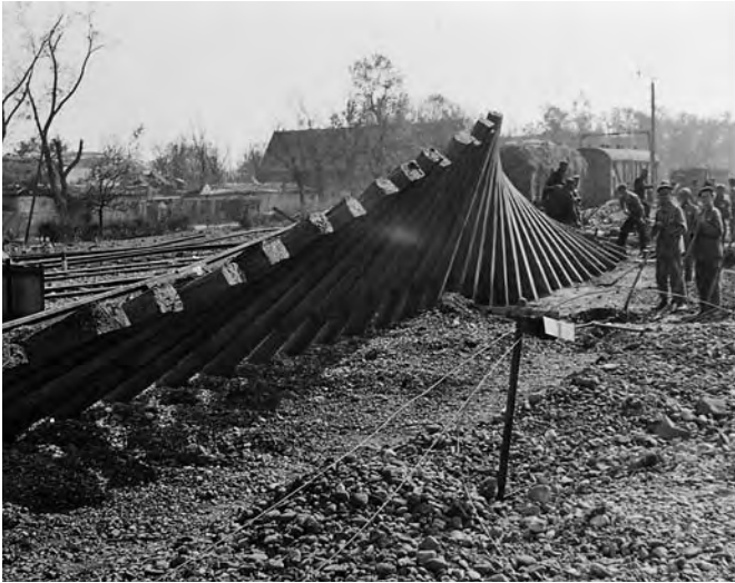
KZ-Häftlinge bei Aufräumarbeiten nach einem Bombenangriff in der Nähe von Augsburg, 1944