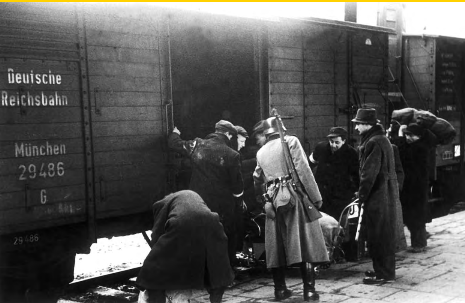
Deportation von Juden am Bahnhof Krakau, nach 1940