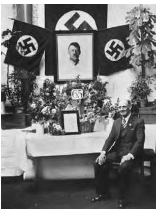
Verabschiedung in den Ruhestand im RAW München-Freimann, 1937